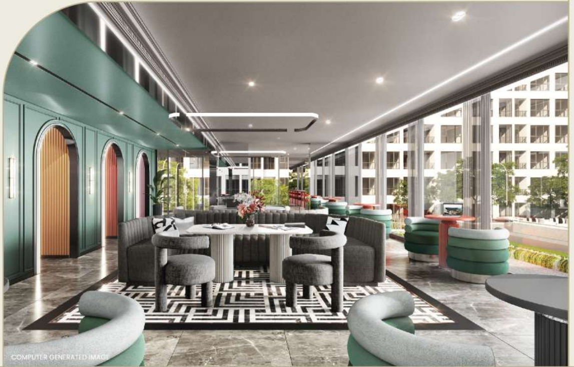
COMPUTER GENERATED IMAGE