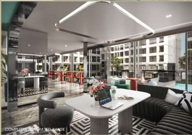
COMPUTER GENERATED IMAGE