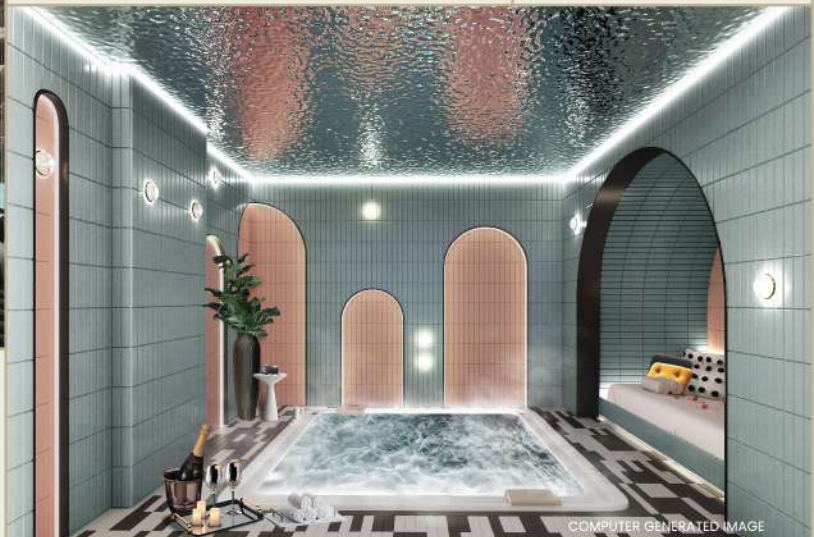
COMPUTER GENERATED IMAGE